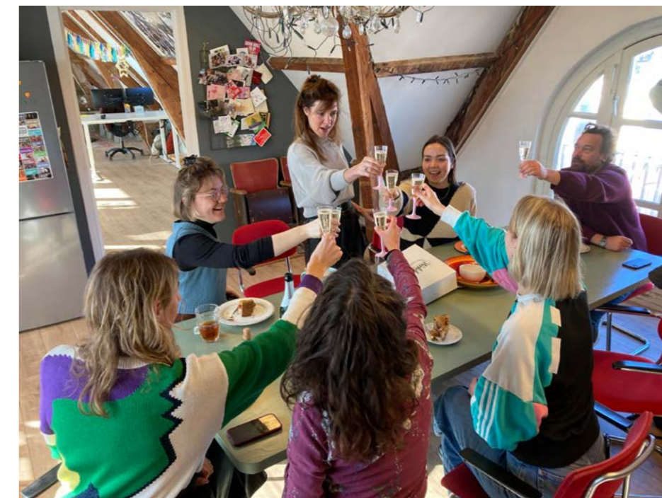
De start van de Nieuwe Makersregeling, 27 februari 2023