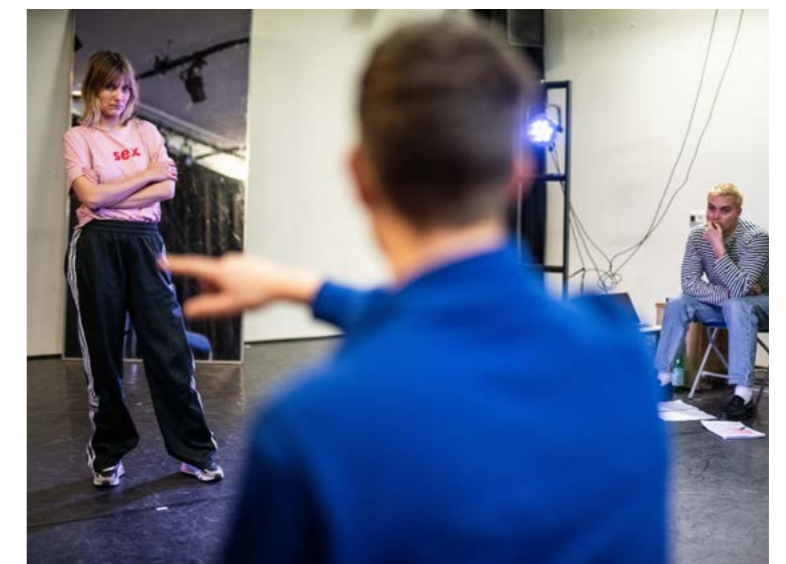
Repetitie De Kont Monologen

Tijdens de werkpresentatie van De Kont Monologen in 2023 leerden wij het bureau (ink). kennen. (ink). is een Social Design Studio die vanaf heden als partner meewerkt aan onze (maatschappelijke) impactprogramma's. Zij gaan ook aan de slag met de verdere ontwikkeling van De Kont Monologen , met als doel het bevorderen van positiviteit rondom seksualiteit. De projecten in De Vrije Ruimte dagen ons uit om andere netwerken aan te boren en vanuit experiment te werken aan innovatie. Het geeft de vrijheid om het publiek vroegtijdig te ontmoeten en mee te nemen in het proces van deze kleinschalige bijzondere projecten.